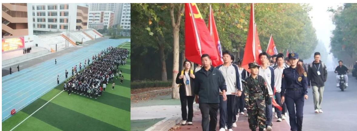
案例 1-1 图远足动员及途中

不积跬步，无以至千里。中午12时30分，全体师生安全返回学校，苦中有乐的远足活动圆满收官。