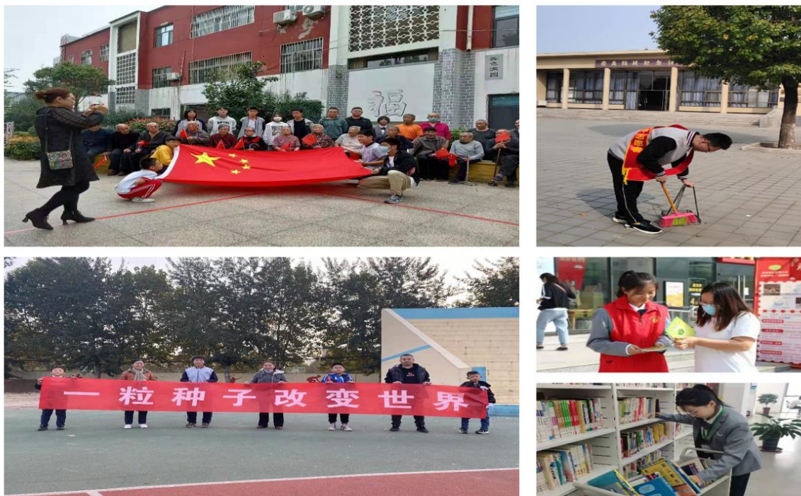
图 3.1 假期社会实践