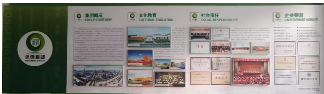
图 5.1 永锋集团介绍