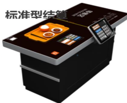
图 2.1 智能餐盘及售餐机

(5) 学校建有较为完善的智能校园网络安防系统，安装有高清摄像头 756 个，重点区域录像储存不小于 90 天。其他区域不少于 30 天，安防系统结合校园千兆局域网对校园进行了无死角监控、包括各级部、宿舍、餐厅、门岗都有独立监控系统。门岗配有一键报警器公安联网，如遇突发情况可第一时间与公安联动。