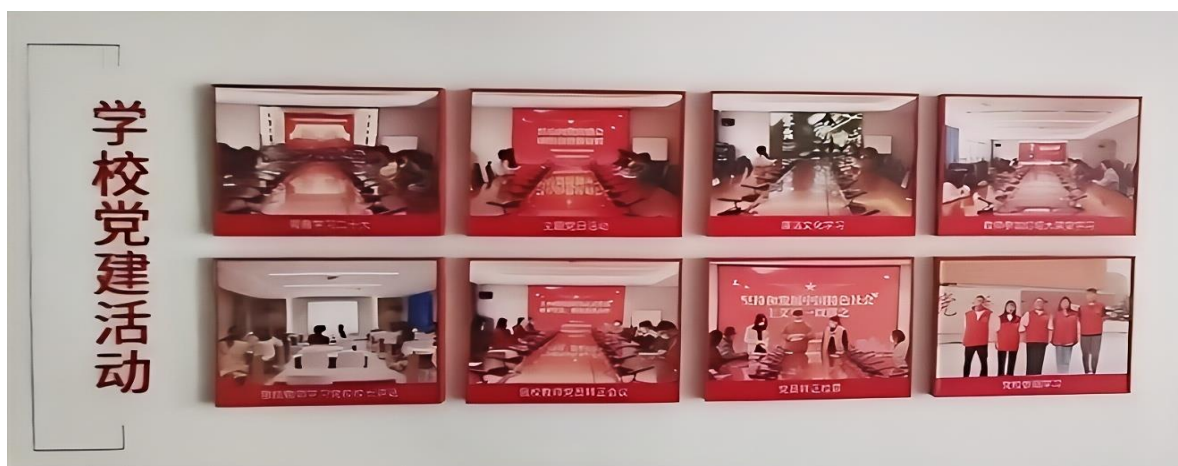
图 4.1 学校党建活动