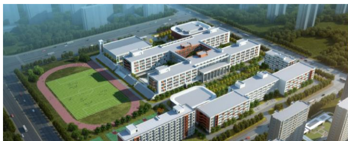
图 1.1 学校效果图

学校根据国家相关标准，建设了近 20 个设施完备、性能先进的校内实训基地，充分满足了各专业实训教学需求，使学生在高仿真的实训环境中熟练掌握真本领，培养“一专多能型”人才。