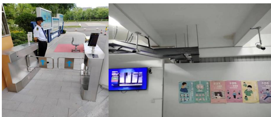
图 2.4 人脸识别出入系统

(7) 学生宿舍楼门口装有 4 台高清人脸识别摄像头，学生出入宿舍进行抓拍，数据后台储存可查询。北门岗南门岗装有 6 台人脸识别出入道闸，可使用一卡通或人脸识别进行通行，方便辨认外来人员，降低安全风险。