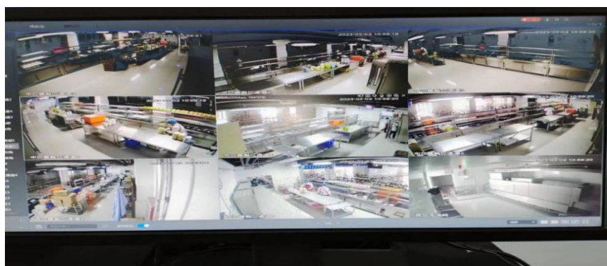
图 2.3 明厨亮灶工程

(6) 学校食堂安装有高清摄像头 140 多个，覆盖餐厅各个区域，通过视频传输技术和显示屏，在就餐区可以随时观看餐饮食品加工制作过程。