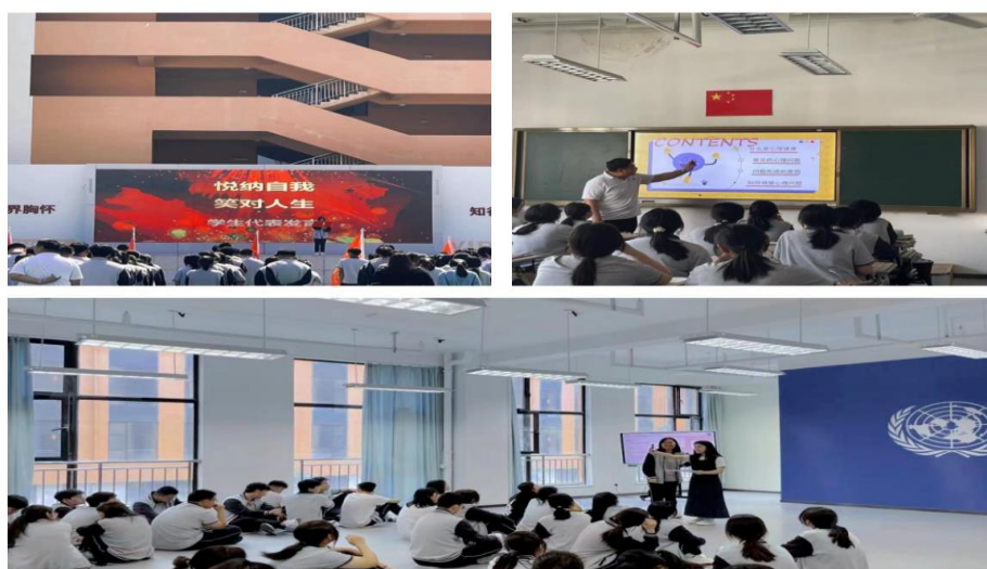
案例 1-2 图心理健康活动

五月虽将过去，但心理健康教育没有终点。德瑞中专坚持把常态化和特殊化心理健康教育相结合，覆盖各个年级，引导同学们进行自我对话，找到成长的契机，从“心”出发，助力“心”成长，实现“心”超越，成为更好的自己。