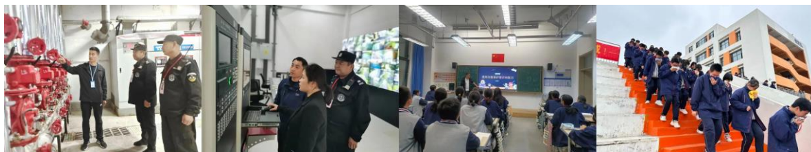
图 5.2 日常培训及演练