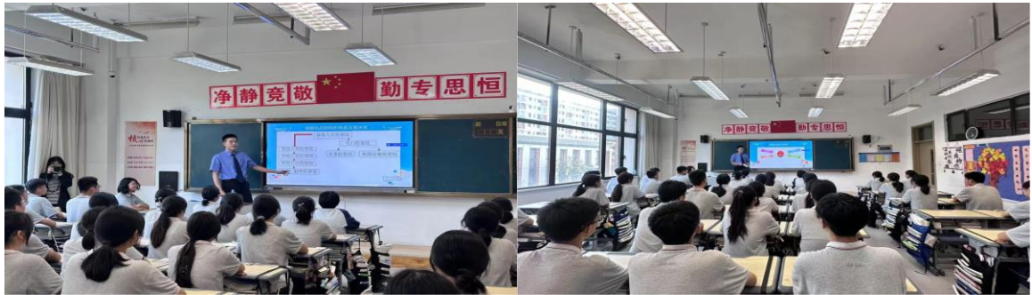
案例 1-5 图检察院普法进校园