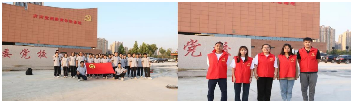
案例 1-4 图参观党员教育体验基地

而且让各位同学接受了一次深刻的红色教育洗礼，进一步激发了全体党员、团员、少先队员的精神力量，汇聚起热爱党、建设祖国、建功新时代的青春正能量。